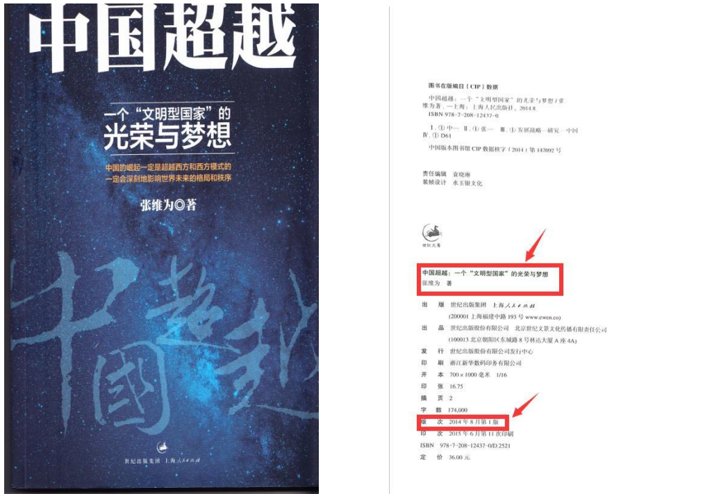
图 7 资格审核材料示例