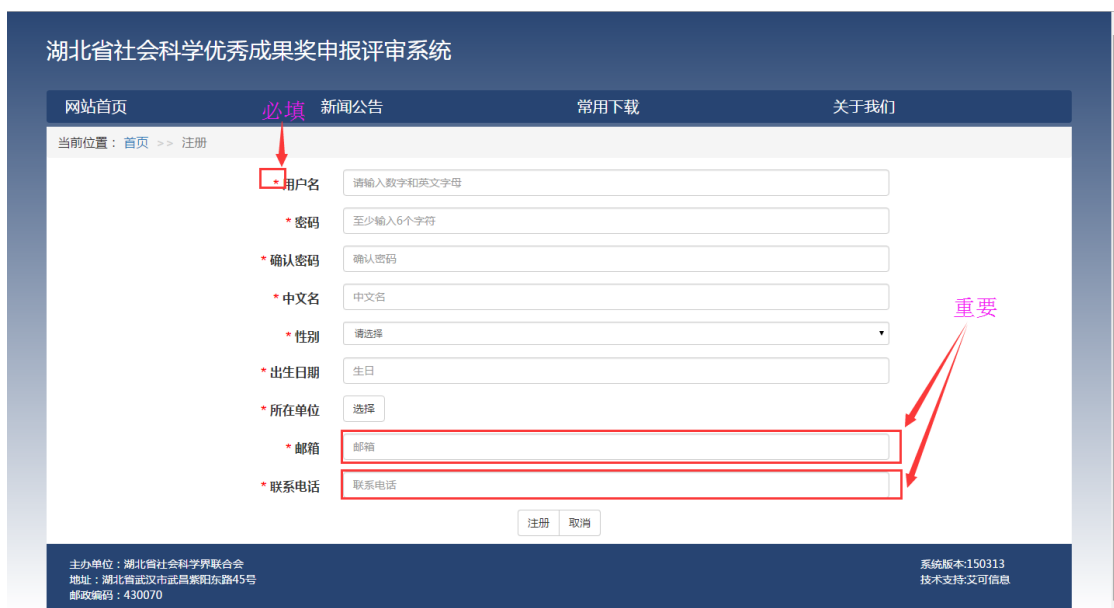
图 2 注册表单

表单中打 * 的字段为必填项，为保证申报和评审的顺利开展，请务必填写个人常用邮箱和联系电话。