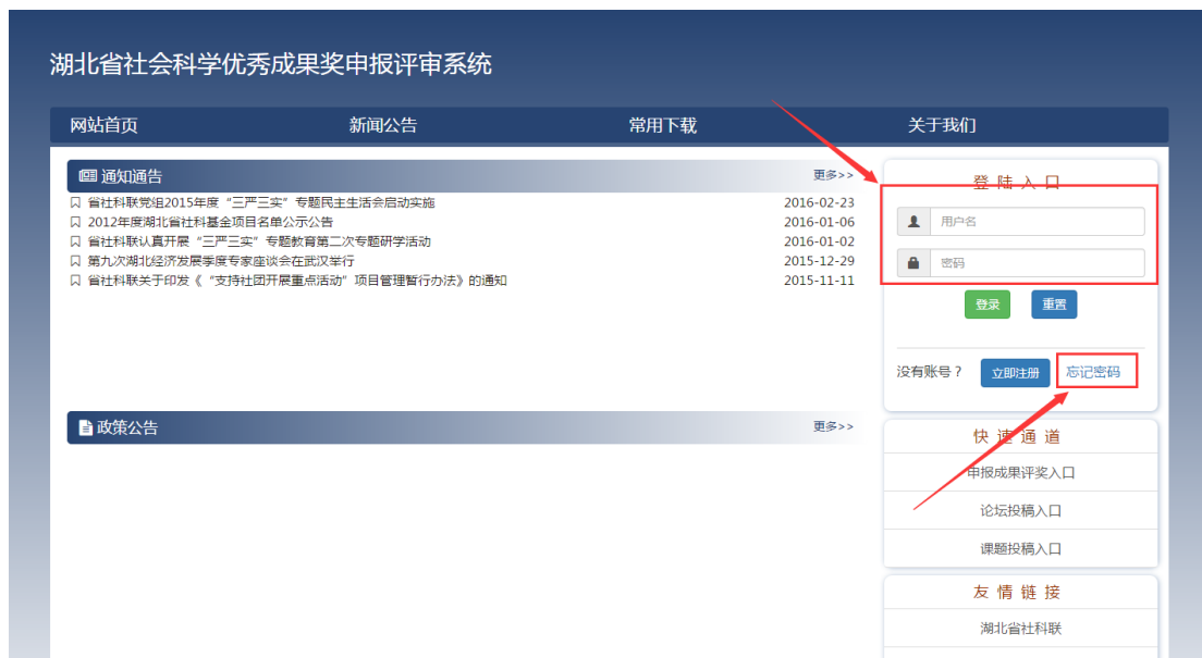
图 3 登录系统

注册账号成果后，返回主页面输入用户名和密码，登录系统；若忘记密码，可点击“忘记密码”，输入用户名和邮箱后重置密码即可。