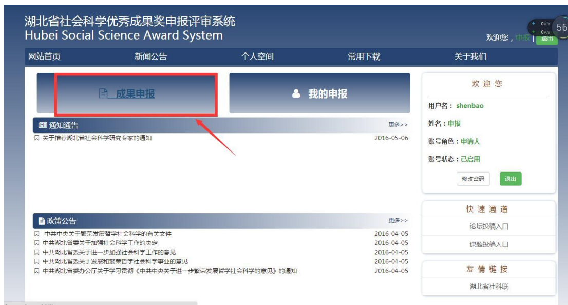
图 4 申报入口