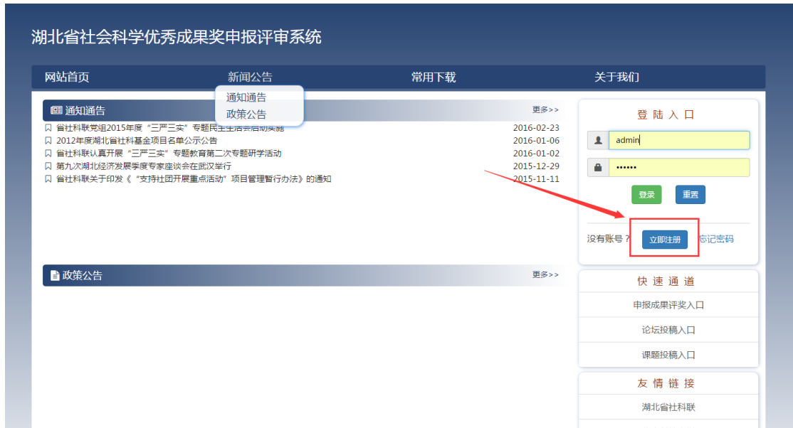
图 1 注册

表单中打 * 的字段为必填项，为保证申报和评审的顺利开展，请务必填写个人常用邮箱和联系电话。